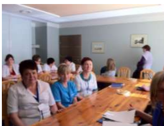
zdjęcie: uczestnicy szkolenia w Szpitalu Specjalistycznym im. F. Ceynowy w Wejherowie