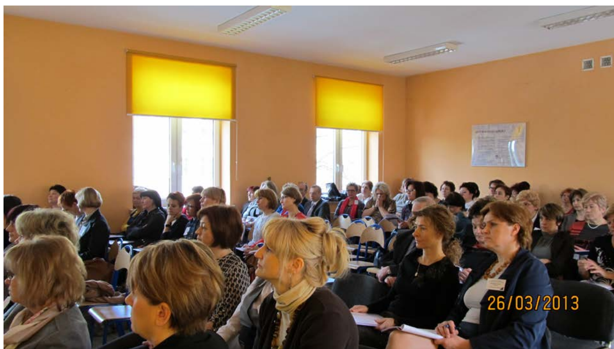
Delegatki XXVII Zjazdu.

W XXVII Okręgowym Zjeździe uczestniczyło 61 Delegatesk i 2 Delegatów.